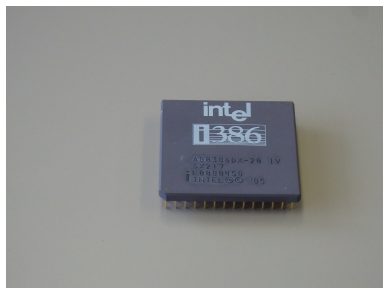
Intel 製 i386 CPU