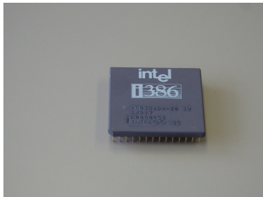
Intel 製 i386 CPU